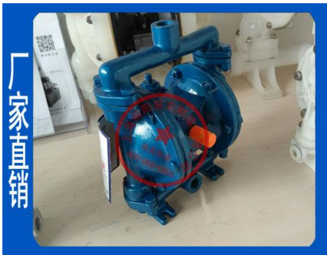
QBY-K15ZD 小型铸钢气动隔膜泵